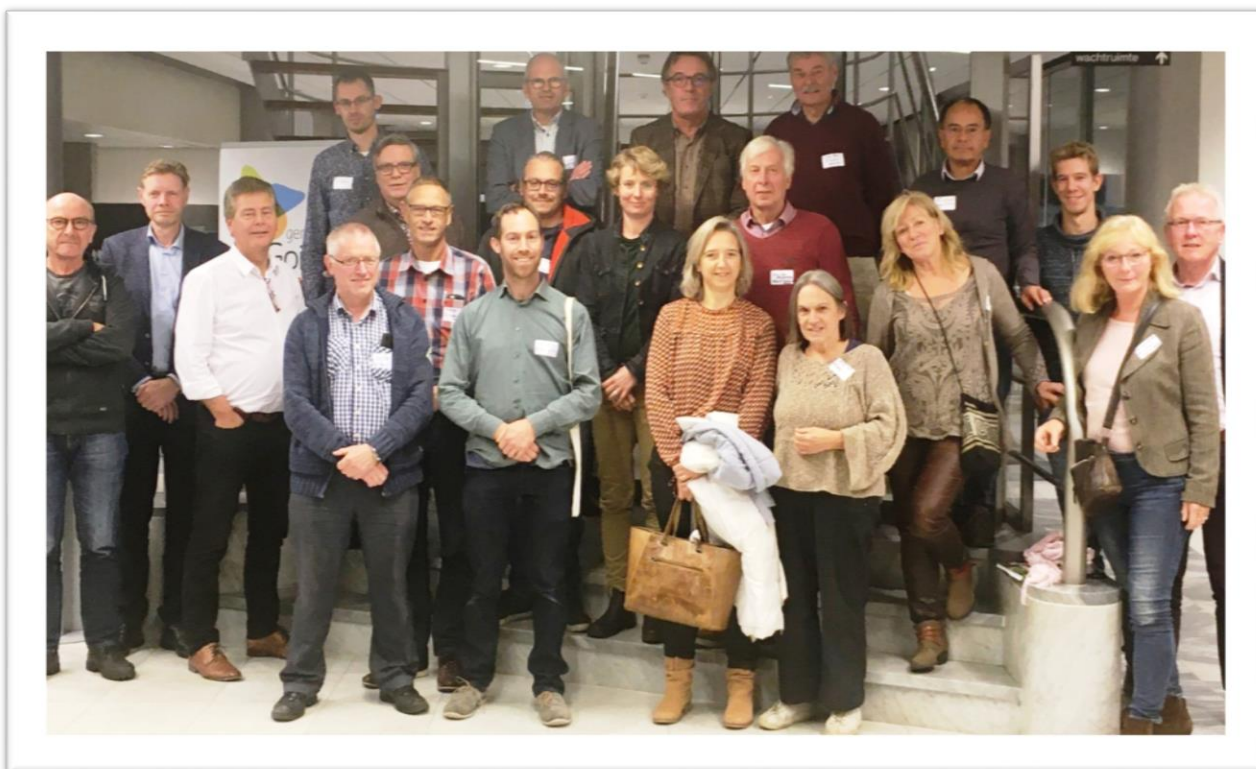
Wethouders, ambtenaren en burgerinitiatiefnemers biodiversiteit staan samen voor basiskwaliteit voor natuur

Drie gemeenten kwamen in de raadszaal van Goirle op de laatste middag van oktober bij elkaar over biodiversiteit: Oisterwijk, Hilvarenbeek en Goirle. Gilze-Rijen schoof spontaan aan. Wethouders, ambtenaren en leden van Biodiversiteitsteams luisterden naar een presentatie over vogels en biodiversiteit, waarna ze zich over werkgroepen verdeelden. De middag eindigde met diverse afspraken en initiatieven, waaronder een krachtige motie, ingebracht in de drie gemeenteraden. Biodiversiteit staat voor een fors en aaneengesloten gebied in één klap hoog op de agenda.