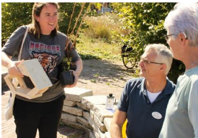
Gezelligheid tijdens de najaarsactie 2019 van Groener Goirle