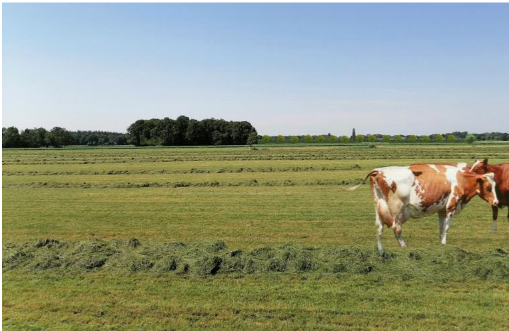
Impressiefoto na landschappelijke inpassing, gezien vanaf de Abcovensedijk