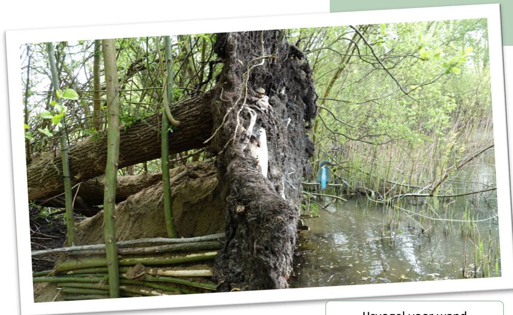
Ijsvogel voor wand